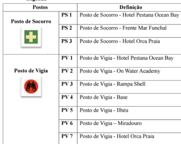
Figura 1 – Croqui do posicionamento na promenade da Praia Formosa dos Postos de socorro e de vigia